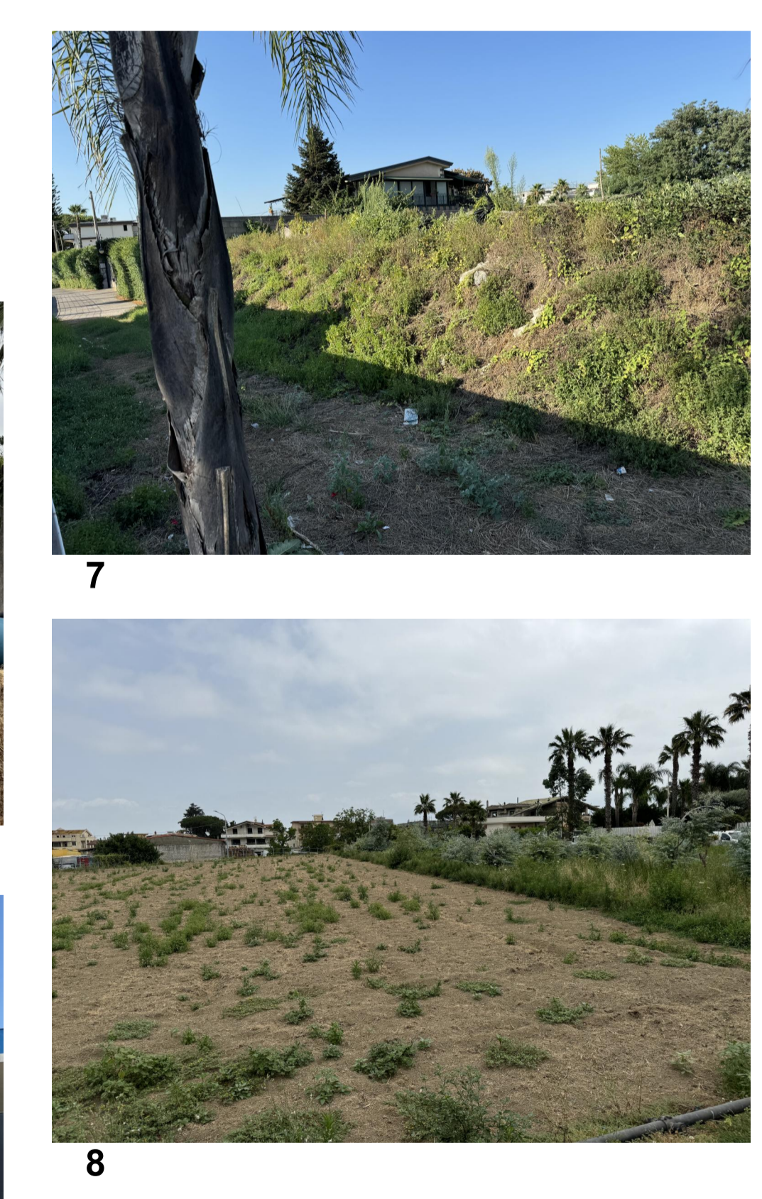
RILIEVO FOTOGRAFICO STATO DI FATTO