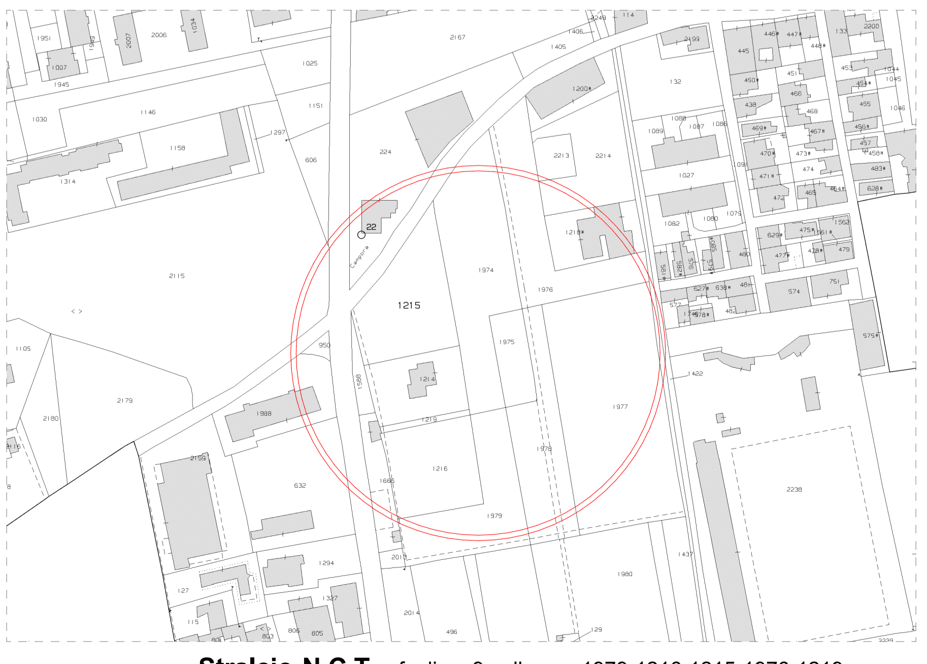
Stralcio N.C.T. - foglio n.9, p.l.l.a n. 1979-1216-1215-1976-1219